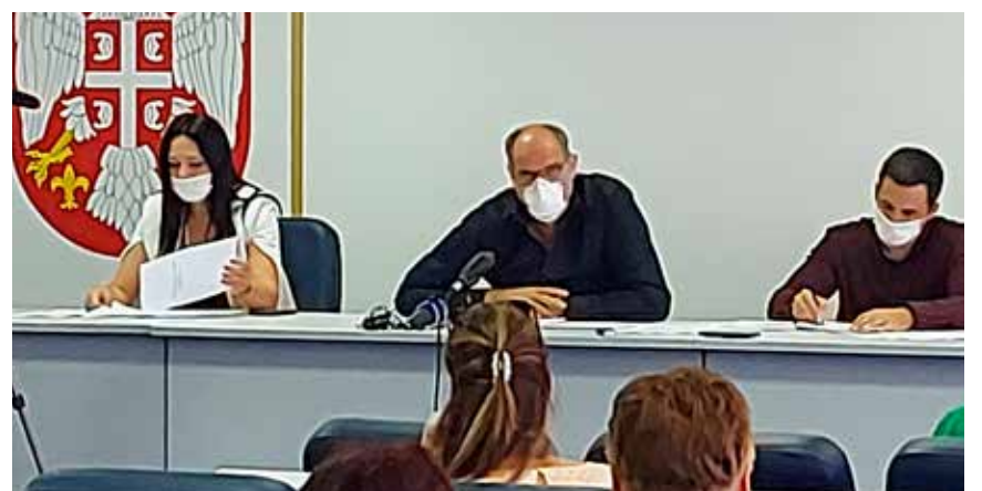
Са седнице Општинског штаба за ванредне ситуације у Мајданпеку