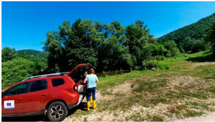
Узорковање на Поречкој реци

- У оквиру пројекта предвидели смо и куповину једног теренског возила које нам је неопходно за узорковање површинских вода које су